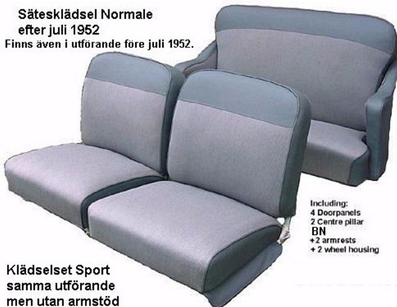
Sätesklädsel Normale efter juli 1952

Dessa set innehåller ny klädsel till framstolar & baksäten, tyg till dörrsidor & div paneler.