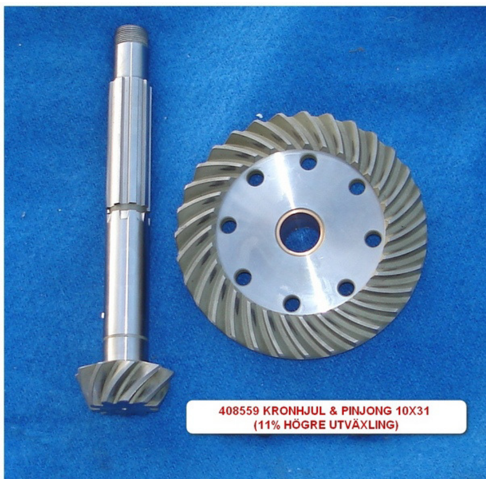
408559 KRONHJUL & PINJONG 10X31 (11% HÖGRE UTVÄXLING) (endast beställning) 11500:-